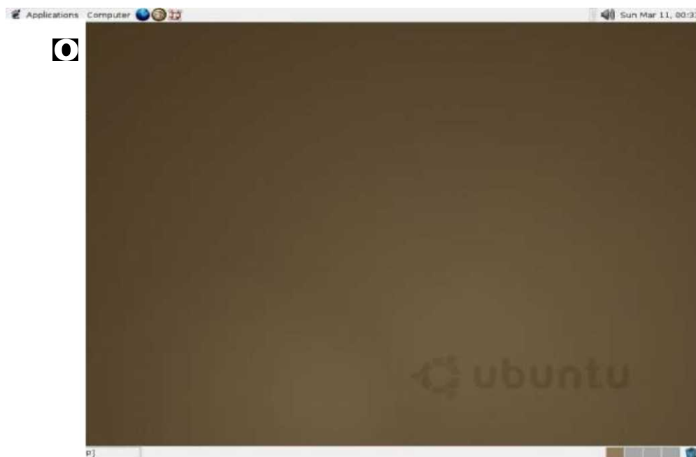
Слика 4. Работна површина на првата верзија, UBUNTU 4.10

Така ознаката 4.10 значи дека изданието од Октомври 2004 година, со кодирано име Warty Warthog (брадавичавото диво прасе).