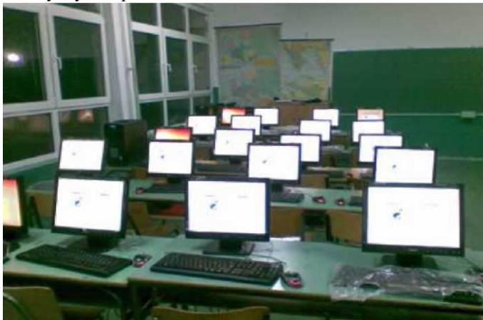
Слика 6. Едубунту на компјутерите во основните и средните училишта во РМ

Исто така, зборувајќи во светски рамки неизбежно е да не се спомне и за проектот на Министерството за образование и наука на Република Македонија, кое спроведувајќи ја својата програма ги снабди сите основни и средни училишта со компјутери, на кој е инсталирана Едубунту варијантата на Убунту Оперативниот систем.