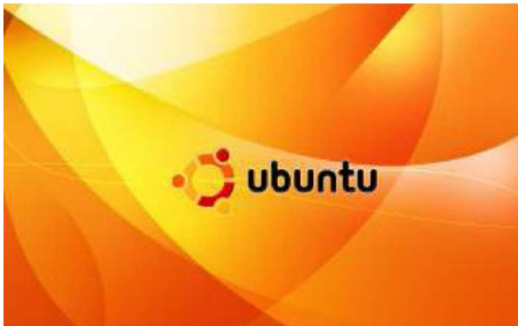
Слика 1. Логото на Убунту, сместено во една од позадините