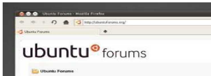
Слика 7. Убунту форумите на http://ubuntuforums.org

Меѓу најпознатите такви сервиси се т.н. Планета Убунту (planet.ubuntulinux.org), форумите сместени на www.ubuntuforums.org и без број други. Секако, постои и популарниот систем за онлајн дискусии IRC (Internet Relay Chat), сместан на каналот #ubuntu и истиот е на англиски јазик. Вакви канали постојат и другите светски јазици, но сепак каналот на англискиот јазик е најдобар и најползен. Таканаречениот Фрижидер на Убунту е исто така место да се добијат одредени информации од Убунту светот. Главно, овие информации сместени на fridge.ubuntu.com се топ информации поврзани со она што е ново во светот на Убунту, кои се тековните новости и популаризации на Убунту и што се очекува во иднина.