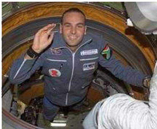
Слика 2. Марк Шатлворт во вселенска мисија

Поради тоа, во 2002 година Шатлворт решил да донира околу 20 милиони американски долари за учество во Вселенска мисија на Руската Вселенска Програма. Во мисијата тој поминал 2 дена во ракетата Сојуз и 8 дена во Меѓународната вселенска станица, каде што учествувал со експерименти поврзани со сидата и истражувањата на генетските материјали.