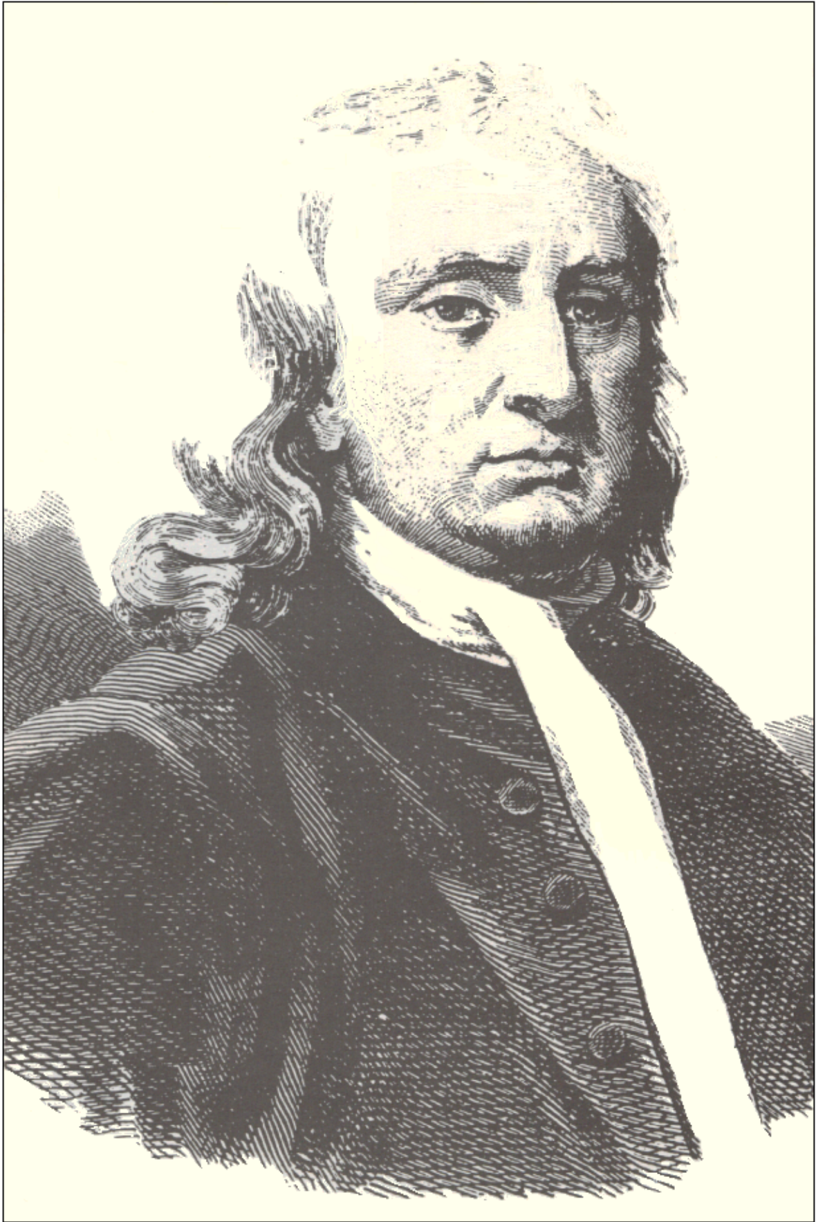
SI.5. Sir Isaac Newton