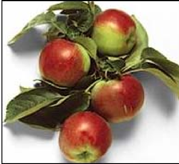
Sl.1. Jabuka – biljka koja je, navodno, pomogla Newtonu u otkrivanju zakona gravitacije

Jedan moj prijatelj rekao je neki dan u šali U trenutku kad sam se rodio i kad sam ispao iz majčine utrobe u naručje doktora, zapitao sam se kakva je to sila koja me natjerala da izađem iz topline svoje majke. Od tog trenutka prošlo je već puno godina, i stalno me mučilo to pitanje od rođenja – zašto se stvari gibaju tako kako se gibaju i zašto sve pada na pod. Da nije bilo velikog fizičara Isaaca Newtona, ja bih i dan danas živio u neznanju. Zato sam mu neizmjereno zahvalan što mi je otvorio oči i pokazao pute kojima kroči velika sila nazvana gravitacijom. I što još dodati? Hoće li svijet ikada zaboraviti tog velikog engleskog fizičara? Čisto sumnjam. Eto, mene su njegova opažanja navela da malo pobliže proučim njegov život i djelo te, konačno, napišem ovaj maturalni rad. Newton je otkrio nešto što mi danas prihvaćamo zdravo za gotovo, ali u XVII. stoljeću bio je to bauk, bilo je to otkriće koje ni najveći znanstvenici nisu željeli priznati, jer ga nisu mogli shvatiti.