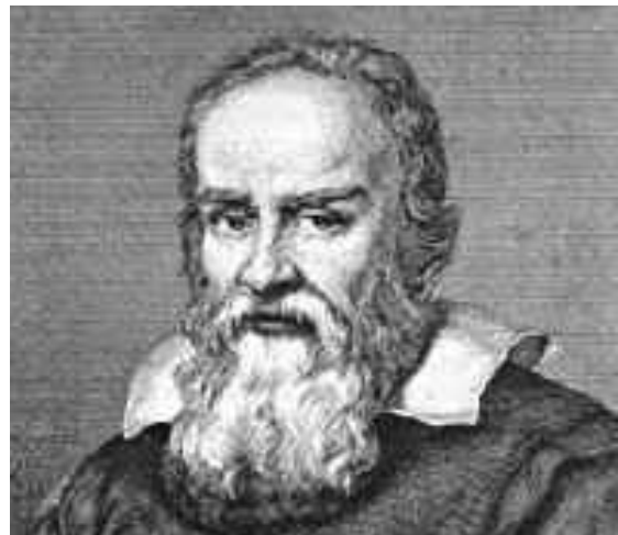
Sl.2. Galileo Galilei

Svoje je tvrdnje Galileo potvrđivao eksperimentom. Tako ga je zainteresirala upotreba pušaka i topova. On primjećuje da bi se tane stalno pravocrtno kretalo kad ga težina ne bi vukla prema dolje. To shvaćanje potkrijepio je i gibanjem uz kosinu. Što je manji nagib kosine, to se kuglica s manjim usporavanjem diže po kosini, a kada nagiba uopće nema, kuglica se kreće konstantnom brzinom. U toj Galileiovoj primjedbi sadržan je zakon ustrajnosti , jedan od osnovnih zakona dinamike, koje ćemo do danas pamtit kao Newtonove zakone.