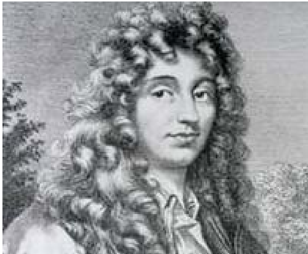
Sl.3. Christiaan Huygens, danski astronom, matematičar i fizičar, razvio teoriju valne optike, prvi opisao Saturnove prstene, razvio teoriju centrifugalne sile pri vrtnji te otkrio polarizaciju svjetlosti